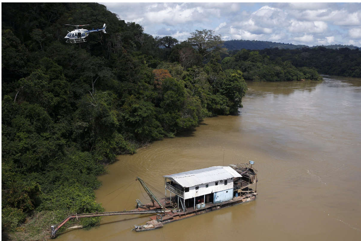
Grupo Especializado de Fiscalização (GEF) realiza operação de combate a garimpo ilegal de ouro no Rio Jamanxim, no Pará, limite da Floresta Nacional Itaituba II.

Hoje, a cadeia de extração e comercialização do ouro advindo de garimpos no Brasil – com foco na Amazônia – é pouco transparente e permeada por uma série de crimes, incluindo a invasão e exploração ilegal de Terras Indígenas (TIs) e Unidades de Conservação (UCs), o trabalho